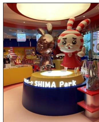
[POP UP STORE]

開催期間 : 2025 年 12 月 2 日（火）～終了日未定 開催場所 : タイ・バンコク サイアムパラゴン 5F 住所 : 991/1 Rama 1 Rd, Pathumwan, Bangkok 10330, Thailand 施設サイト : https://www.siamparagon.co.th/ 営業時間 : 10 : 00～22 : 00（現地時間）