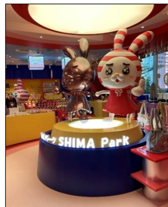
〔POP UP STORE〕