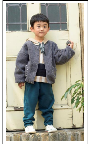
ジャケット 100・110cm 1,790円