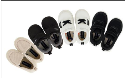
シューズ 13・14・15cm 1,390円