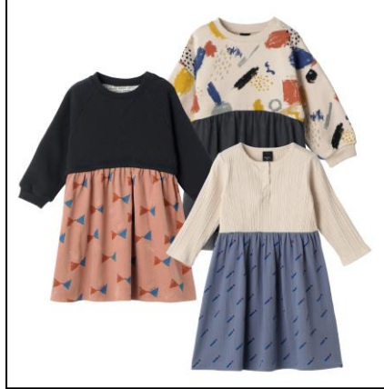
ワンピース 80・90cm 1,390円